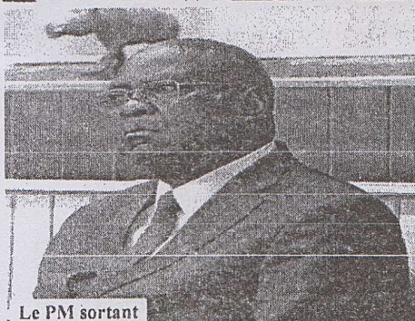
Le PM sortant